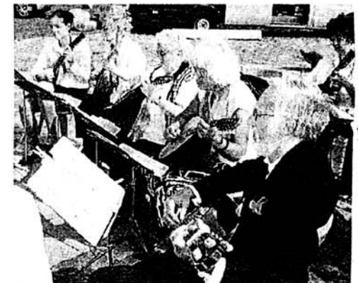
Das Bremer Mandolinenorchester Stolzenfels sorgte für die passende Musik.