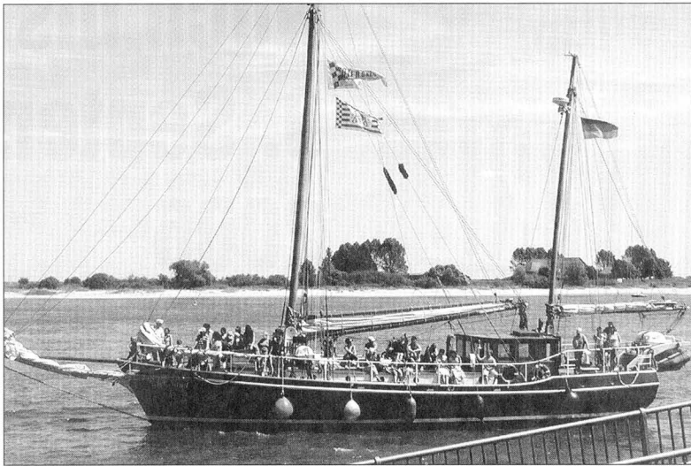
Das Traditionsschiff „Roter Sand“ machte am Nachmittag mit Gästen aus Bremen und Gießen an der Braker Kaje fest.