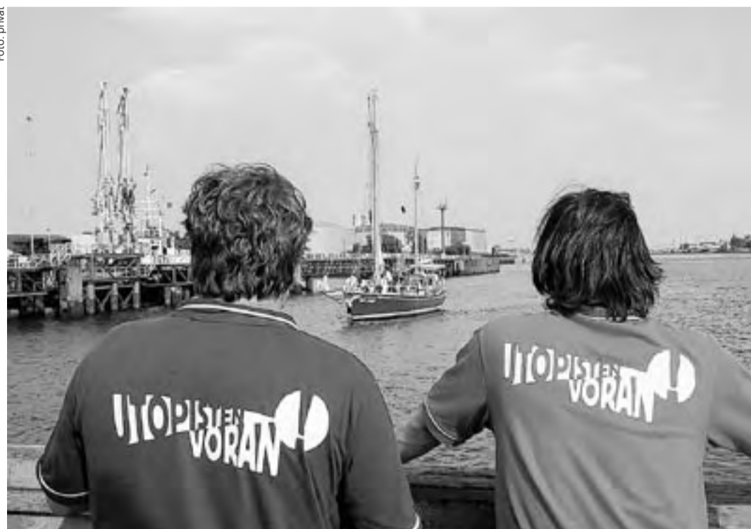
Den Blick nach vorn gerichtet: Auf den Spuren der Utopisten in Bremerhaven.

Der bekannteste der Follen-Brüder ist Karl Follen, Wortführer