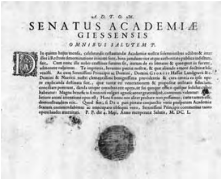
Aushang zur Wiedereröffnung der Universität Gießen am 5. Mai 1650. (r.): „Gutwillige Vererbung“ – Register mit freiwilligen Beiträgen von Gießener Bürgern für die wiedererrichtete Ludoviciana.

Worten des Psalmisten „Alles, was Odem hat, lobe den Herrn!“ aus dem Dunkel des Kirchenraums in das Licht des Tages. Die Univer-